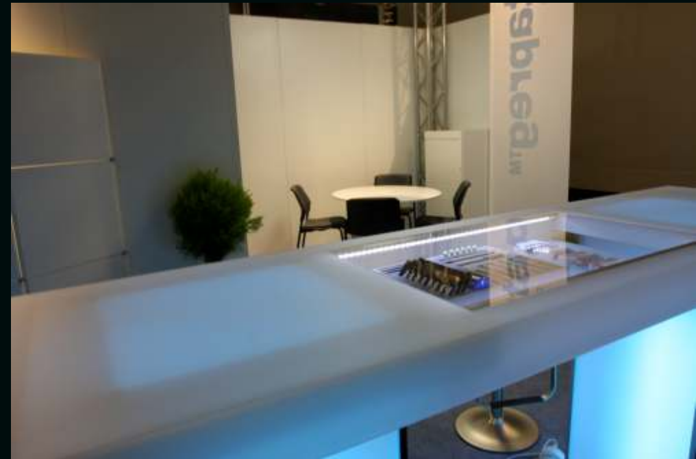
DJ-Pult Aufsatz mit Vitrine